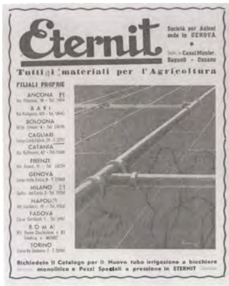
Nelle foto: pubblicità storiche del marchio Eternit